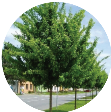
Acer campestre elsrijk