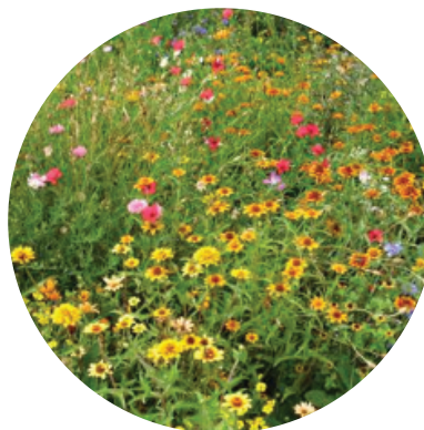
Zmes Karneval - letničky (prvý rok výsadby)