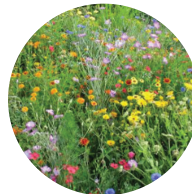
Zmes Karneval - trvalky (druhý a viac rokov výsadby)